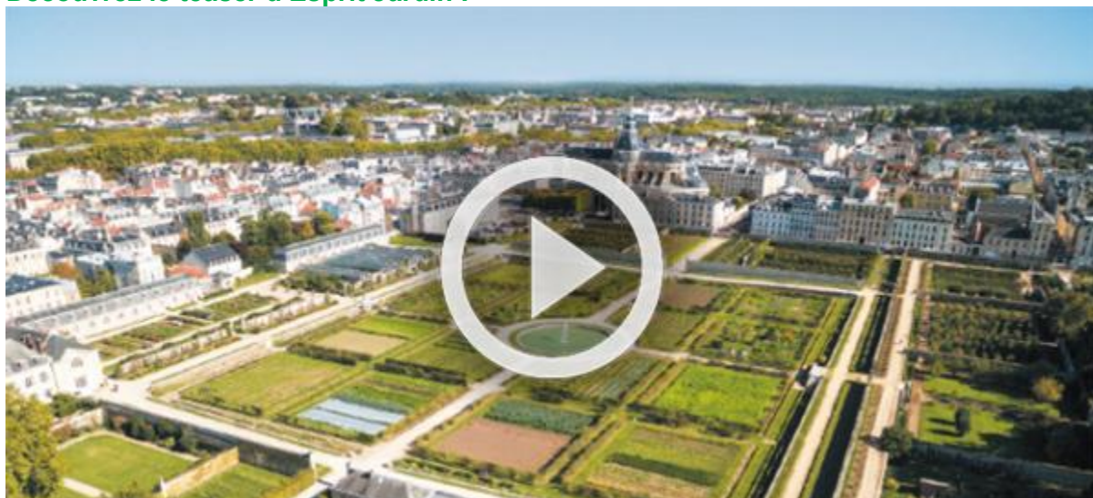
Le Potager du Roi vu du ciel (au loin, la cathédrale Saint-Louis)

Samedi 4 mai : Balade des Trois forêts, de Paris à Versailles, au cœur d'Esprit